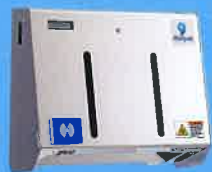
ソルパットmini アドバンス