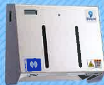
ソルパットmini アドバンス